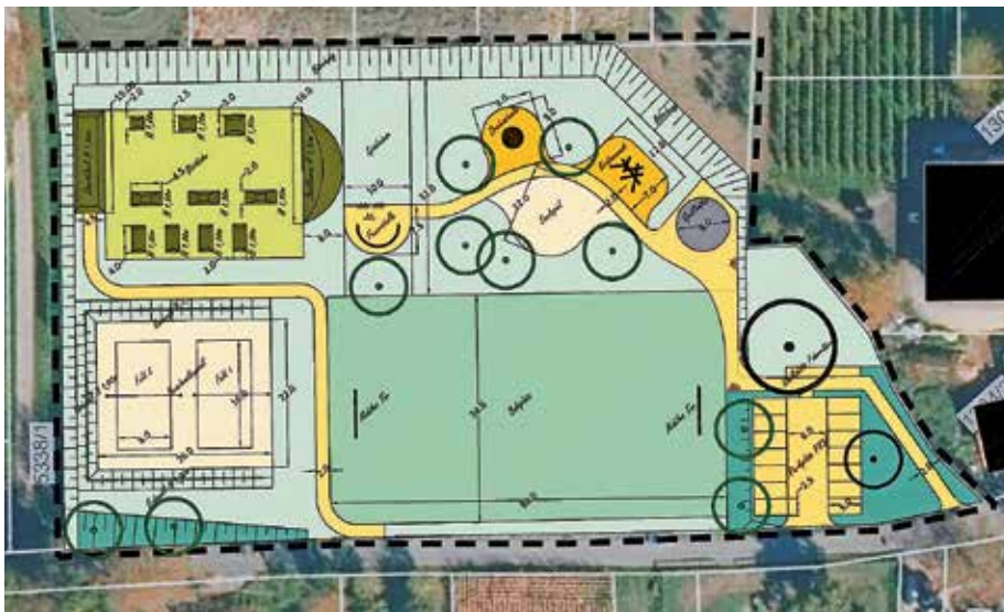
Plan des Bürgerprojekts „Z'mittsdrin“ zwischen Britzingen und Dattingen

Ebenso einstimmig wurde der Haushaltsplan für das Jahr 2023 verabschiedet. Eine Umlage für die Finanzierung des Haushaltes ist nicht vorgesehen. Da eine zeitnahe Auflösung des Gemeindeverwaltungsverbandes angestrebt wird, weist das Zahlenwerk in den Jahren 2024ff keine Investitionen mehr aus. Investiert wird im Jahr 2023 noch in Software, Server und in eine Ablösezahlung für ein mobiles Geschwindigkeitsmessgerät. Der Gesamtbetrag beläuft sich auf über 90.000 Euro. Kosten entstehen bei wenigen Unterhaltungsmaßnahmen durch Brückenbauprüfungen, einer Sanierung eines Teilstücks der Gemeindeverbindungsstraße zwischen Buggingen und St. Ilgen, wie die Ablösezahlungen für die neuen Brückenbauwerke bei Auggen über die Bahnstrecke und aus laufenden Kosten wie etwa die Personalkosten. Die Liquiditätssituation des Verbandes ist gut.